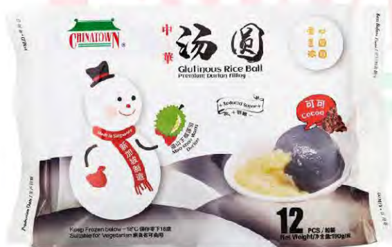
顶级猫山王榴莲馅

汤圆重量: 16克 每包所含: 12粒 (190克) 每箱所含: 24包 每箱总含: 288粒 (4.6公斤)