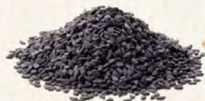
12pcs (Sesame Filling) 芝麻馅