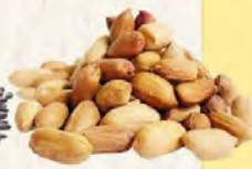
12pcs (Peanut Filling) 花生馅