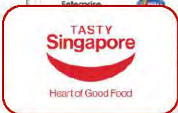
“食尚新加坡”品牌大使